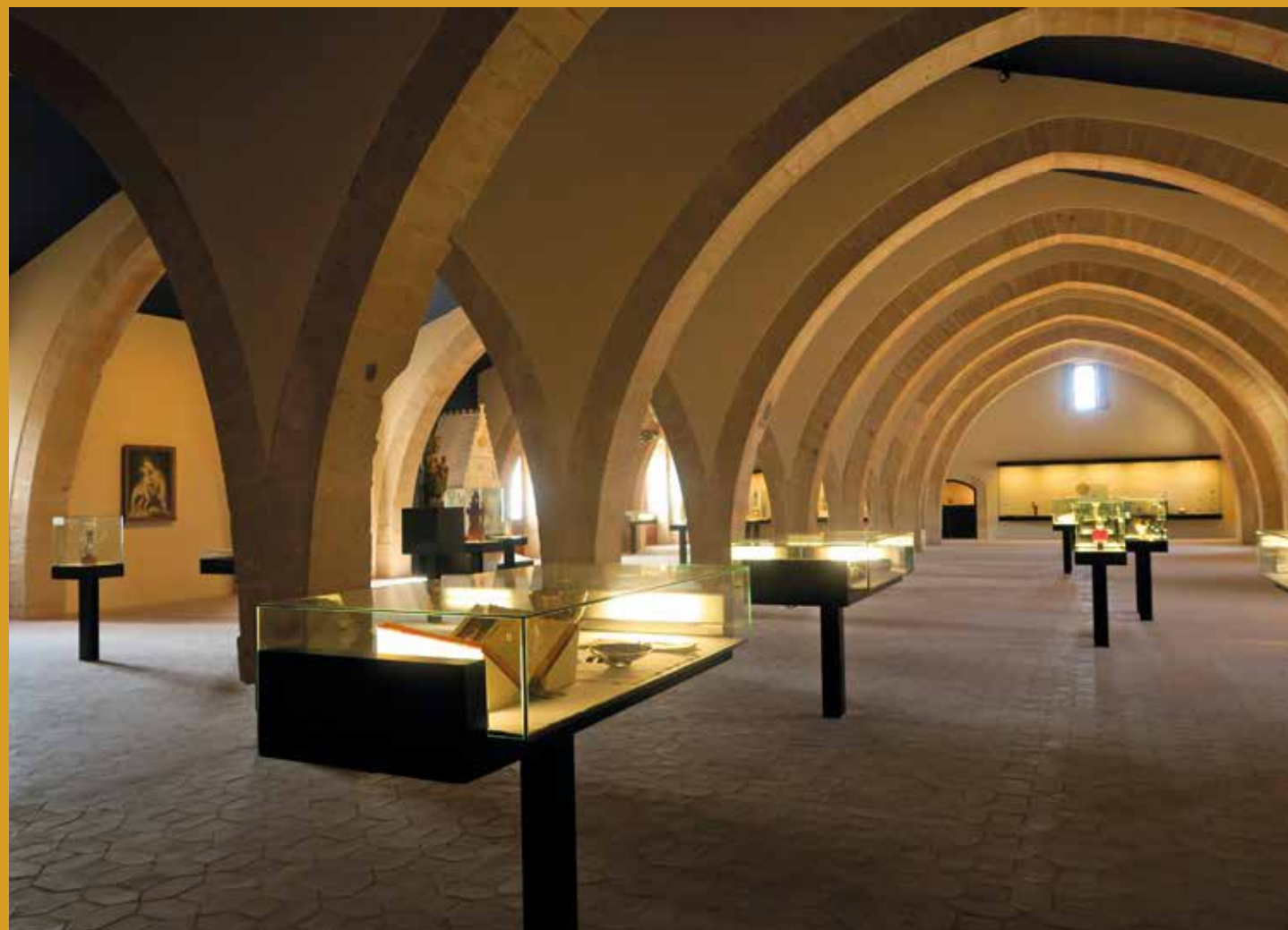
Sala Abat Mengucho del Museu de Poblet. A la pàgina dreta, calze de l'abat Forès, c.1555. Un dels pocs elements del tresor pobletà conservats in-situ.

El monestir obre noves sales on es poden veure obres que mai s'havien exposat