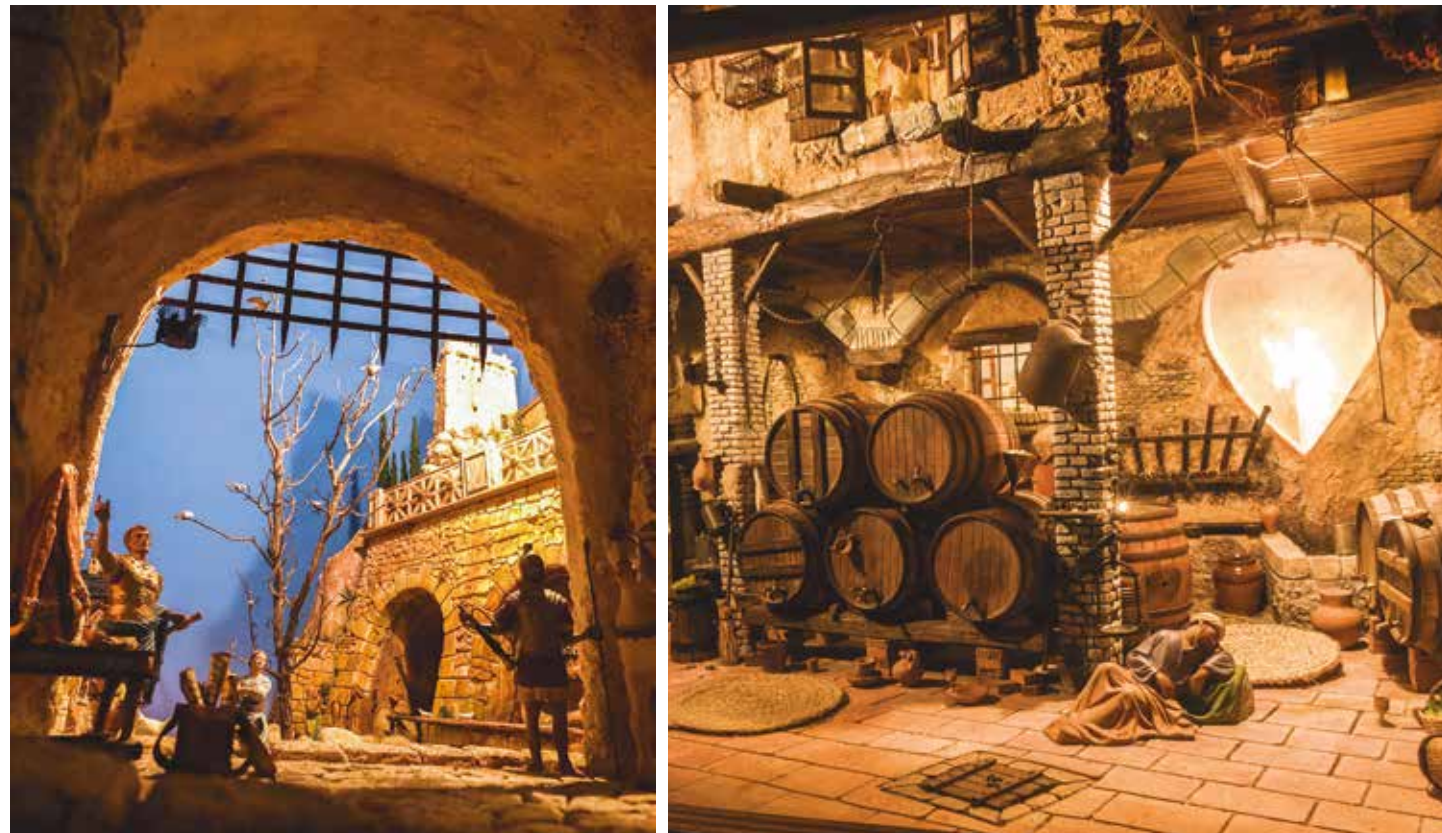
Edicte d'empadronament (1986). Diorama d'Ismael Porta i Balanyà. Figures de Martí Castells Martí i Josep Prats - El somni de Josep (1984). Diorama d'Ismael Porta i Balanyà. Figures Germans Castells.