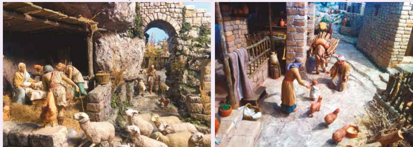
Naixement (1979). Diorama de Joan Mestres i Baixas. Figures de Daniel José Ursueguía - Els primers passos (2005). Diorama de Joan Mestres i Baixas. Figures de Martí Castells Martí.