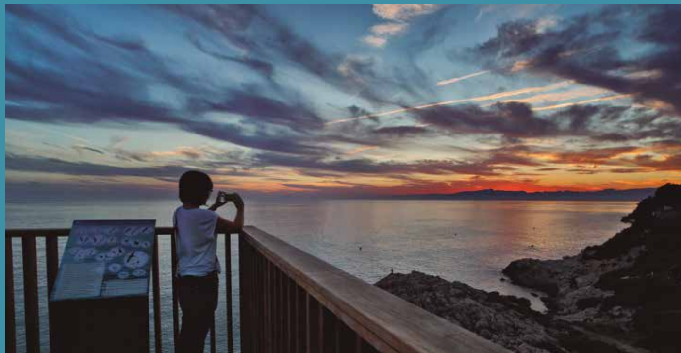
PIRATES I CORSARIS AL CAP DE SALOU

Posta de sol des del mirador del cap de Salou. Salou, Tarragonès.