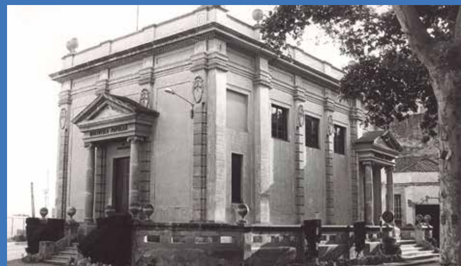
Biblioteca popular de El Vendrell.

Des del meu punt de vista, tot el que la Mancomunitat de Catalunya va posar en marxa, va ser el projecte d'una ment clara, la del president Enric Prat de la Riba, que va saber integrar en el seu entorn esforços i persones de procedència ideològica diversa per posar en marxa un nou país. Una sola frase pot definir en gran mesura quin era el seu objectiu: « Que no hi hagi un sol Ajuntament de Catalunya que deixi de tenir, a part dels serveis de policia, la seva escola, la seva biblioteca, el seu telèfon i la seva carretera ». S'havia proposat, doncs, modernitzar el país.