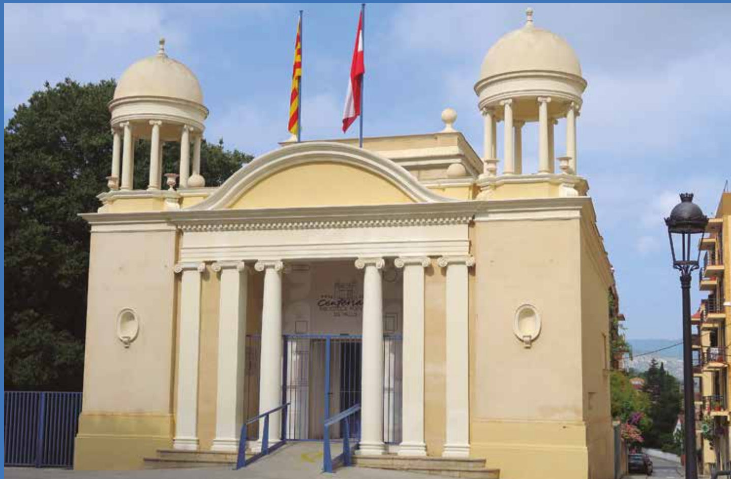
Biblioteca Popular de Valls - A la pàgina dreta: Sala de lectura de la Biblioteca Popular de Valls. 1918.

La Biblioteca Popular de Valls ha complert els primers cent anys d'existència, i amb ella ha arribat a la mateixa edat la xarxa de biblioteques que va posar en marxa la Mancomunitat de Catalunya del president Enric Prat de la Riba. El 23 de juny de 1918, el seu successor, Josep Puig i Cadafalch, inaugurava la Biblioteca Popular de Valls, la primera que posava en marxa la Mancomunitat. Cent anys després, la xarxa, no només ha crescut i s'ha escampat arreu del país, sinó que s'ha multiplicat, s'ha diversificat i ha mutat significativament, adaptant-se al temps actual i a les necessitats i demandes que els ciutadans d'avui exigeixen.