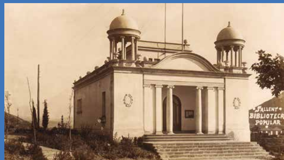
Biblioteca popular de Sallent.