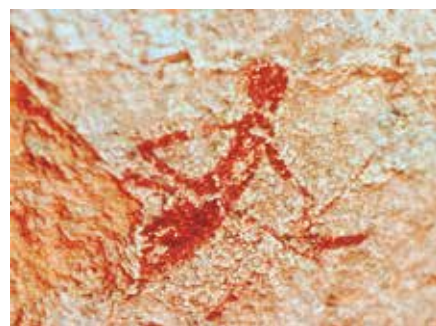
Pintura del conjunt rupestre del barranc del Mas d'en Llort

En diverses ocasions, hem argumentat que l'Art Llevantí, situat dins del marc de les serralades del prelitoral, constitueix un conjunt de documents arqueològics únics i excepcionals al continent europeu.