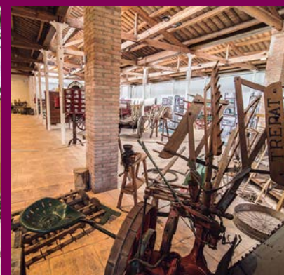
Ordidor. L'ordit és de molt delicada preparació i el resultat del teixit depèn en gran manera d'aquest. Peça ben ordida és mig teixida. Telers centenaris que continuen funcionant i teixint. El Centre d'Interpretació està situat en el recinte de La Fàbrica. El Museu Agrícola compta amb una extensa col·lecció d'estris agrícoles i amb una bona representació de carros i carruatges.