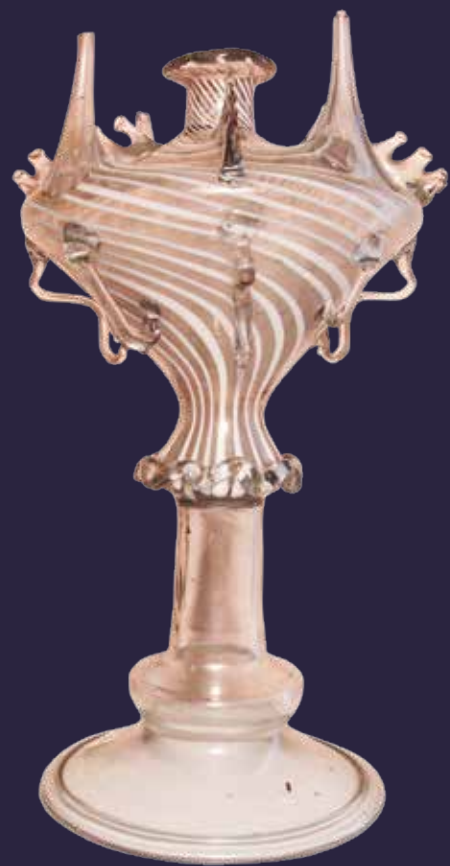
L'ALMORRATXA DE VIDRE

Almorratxa. Catalunya, s. XVIII. Col·lecció particular, Barcelona.