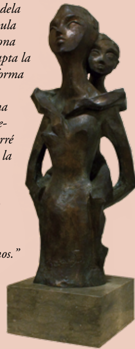
Mare i Fill (Madre e Hijo), bronce. Museo de Arte Palau Ferré (Montblanc)