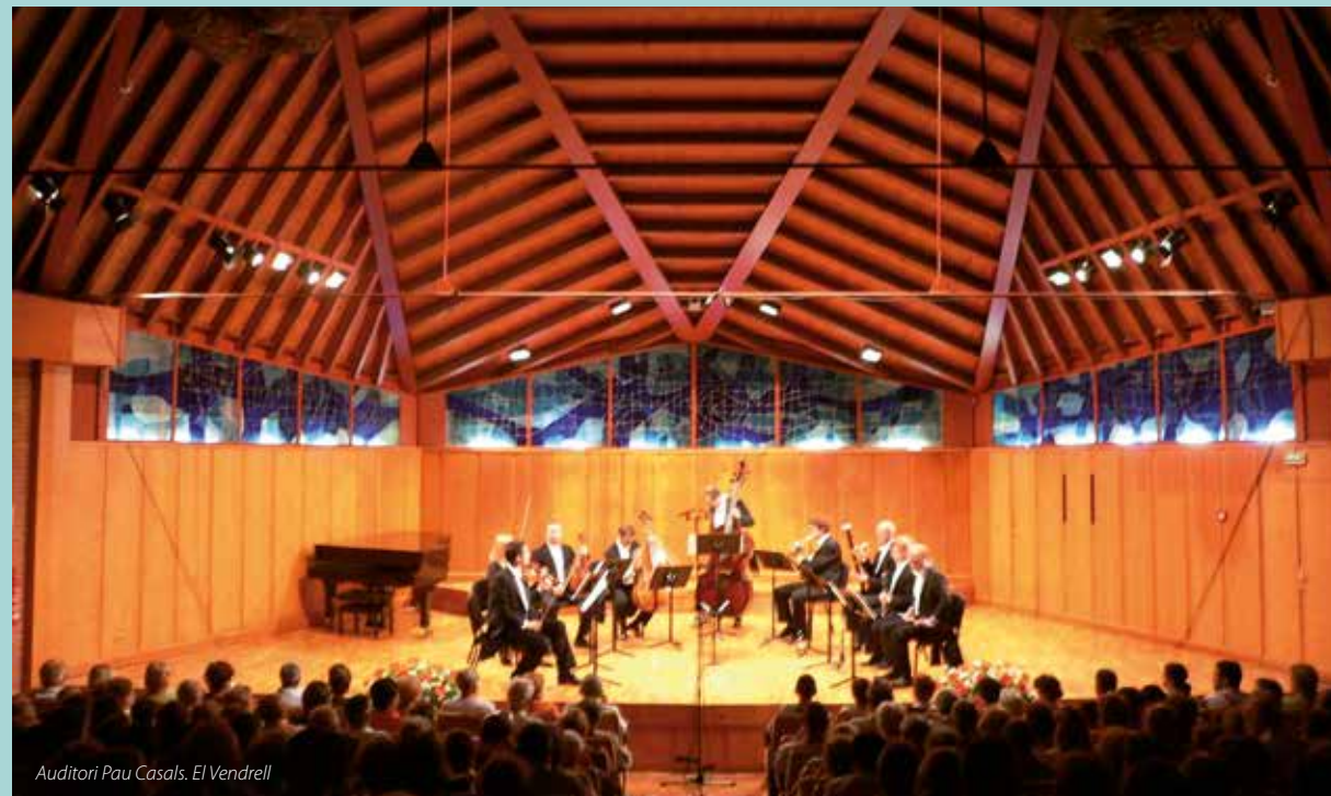
Auditori Pau Casals. El Vendrell

Patronat Municipal de Turisme del Vendrell Av. Brisamar, 1 43880 Coma-ruga (El Vendrell) Tel. 977 68 00 10 Fax 977 68 36 54 www.elvendrellturistic.com www.elvendrell.net