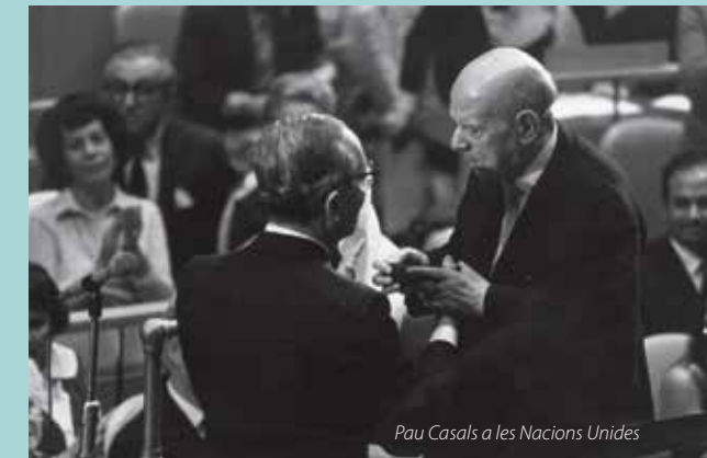
Pau Casals a les Nacions Unides

Su vinculación con El Vendrell fue constante y firme. Por todo ello, la población de El Vendrell ama y admira la figura del maestro Pau Casals y le rinde homenaje mostrando a los visitantes los pasajes más importantes de su vida y su obra, reunidos en su casa natal de El Vendrell y en el museo de la Villa Casals, la residencia de verano que hizo construir en la playa de Sant Salvador. En este emplazamiento se pueden contemplar objetos y recuerdos de su vida personal y musical, además de las obras de arte que contiene, entre las que destacan las esculturas de su acogedor jardín mediterráneo con vistas al mar. Frente a la Villa Casals, se encuentra el Auditorio Pau Casals, erigido a fin de colmar una de las voluntades esenciales del maestro: aproximar la música y la cultura a todas las personas. El edificio es obra del arquitecto Jordi Bonet y se integra dentro del espacio de la plaza J. S. Bach.