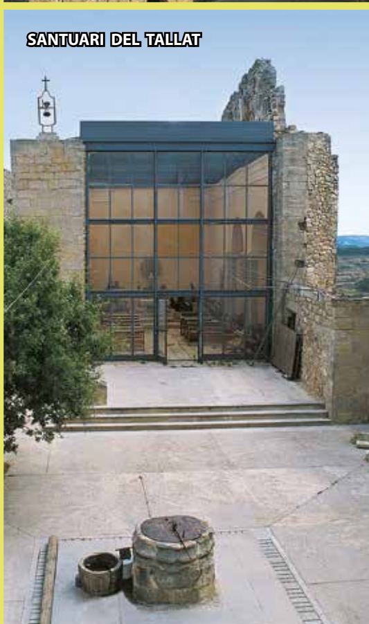
SANTUARI DEL TALLAT