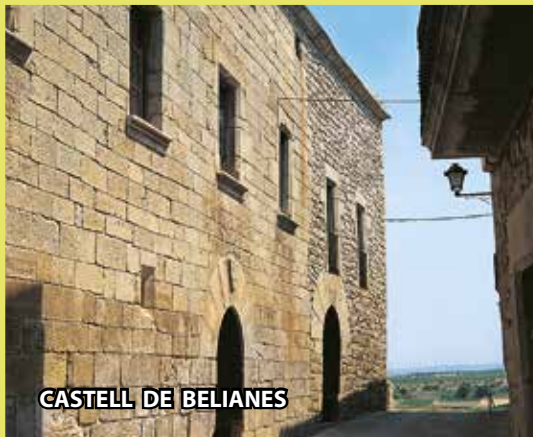
CASTELL DE BELIANES