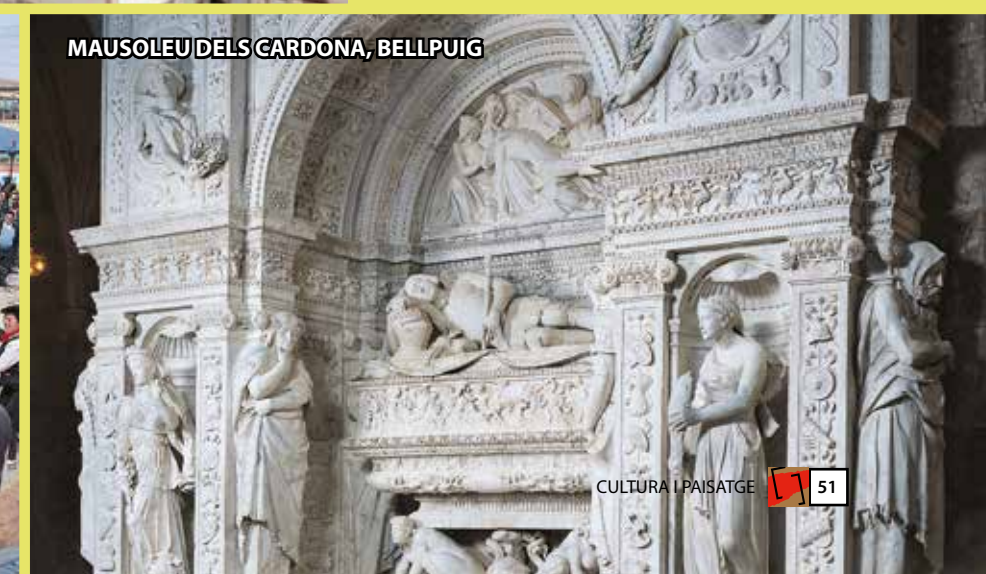
MAUSOLEU DELS CARDONA, BELLPUIG