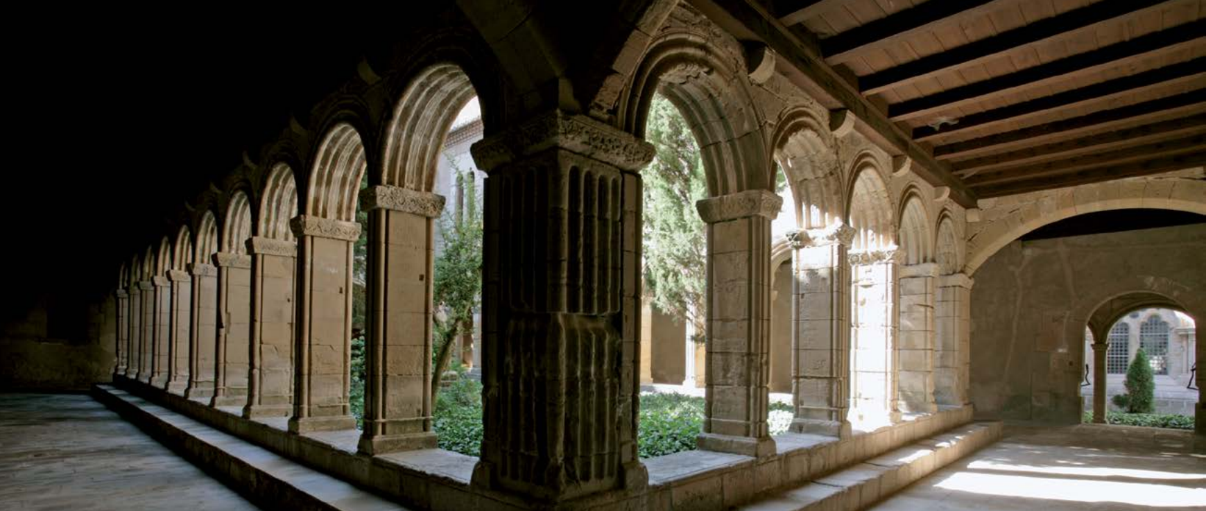
El claustre de Sant Esteve o de la infermeria del monestir de Santa Maria de Poblet és un dels claustres menors o interiors, desconegut per la majoria de visitants.