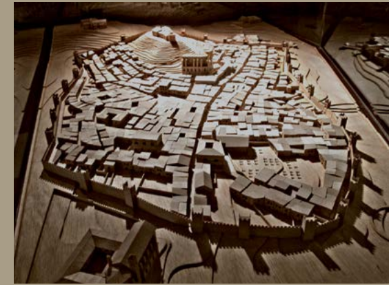
LA MURALLA DE MONTBLANC