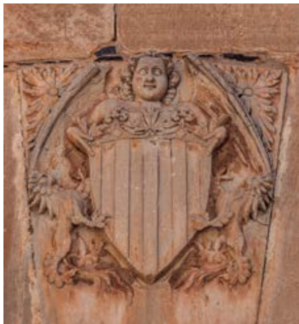
POBLET Porta Reial. Escuts de Pere el Cerimoniós i de Catalunya, ambdós de Jordi de Déu (s. XIV)