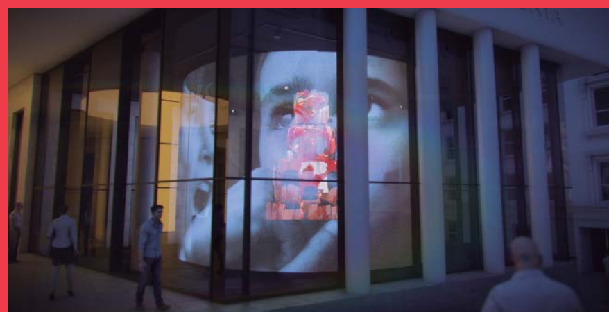
A dalt, imatges de dos espais de l'acte II: SENY I EQUILIBRI. A sota dues imatges de l'espai de l'acte III (interior i exterior).