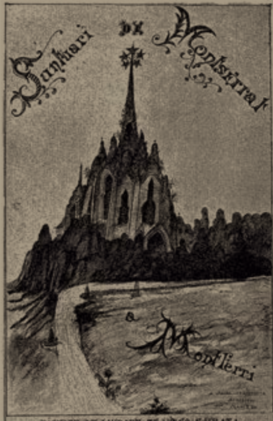
Dibuix de Jujol amb la idea del Santuari de Montserrat (1924 o 1925).