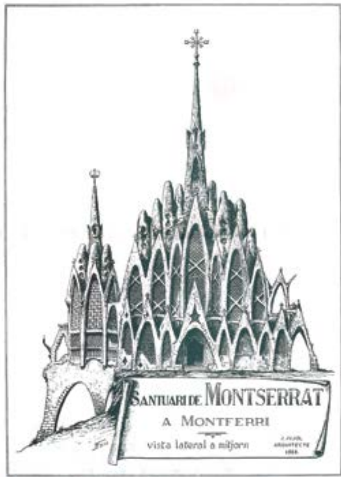
SANTUARI DE MONTSERRAT DE MONTFERRI

A la doble pàgina anterior: imatge nocturna del Santuari de la Mare de Déu de Montserrat de Montferri.