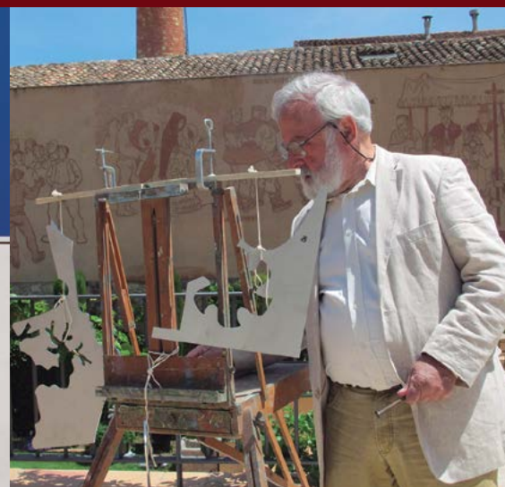
Instal·lació de l'obra "La màgia de les ombres" al Museu de la Vida Rural de l'Espluga de Francolí. D'esquerra a dreta: l'hort, l'oli, el vi i el blat. Plafó del vi, de la verema i de la tardor.