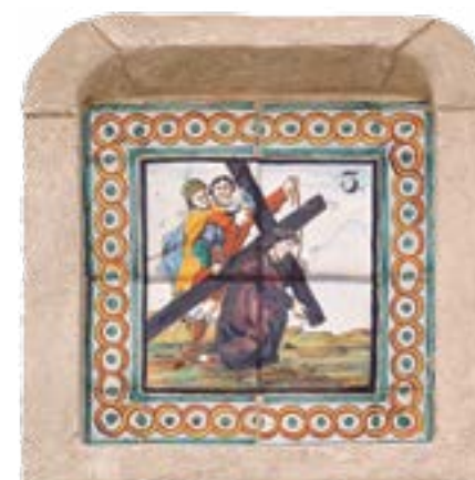
Estació número 3 del viacrucis de Passanant. Del viacrucis de rajoles de ceràmica catalana de Passanant, (s. XVIII) un dels pocs que es conserven a Catalunya, en podem contemplar set plafons que es troben entre el carrer del Castell, el carrer del Forn, el carrer Major i l'església parroquial de Passanant.

Per a més informació, vegeu: Sobre els viacrucis de Bellpuig i de Passanant. Nota ceràmica a Torregrossa, de Joan Yeguas i Gassó. Quaderns d'El Pregoner d'Urgell, núm. 27 (2014).