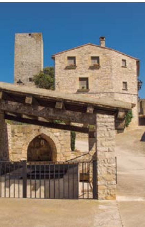
Glorieta, els rentadors i la font.