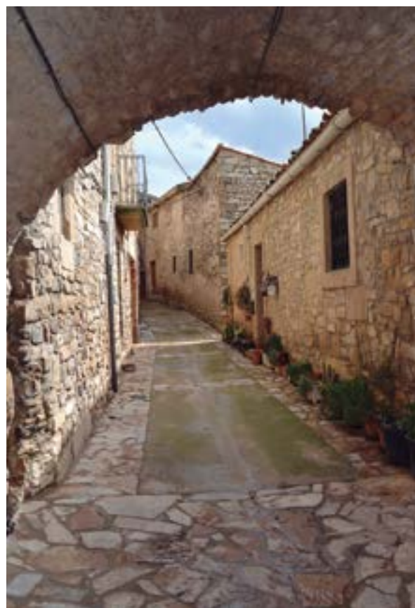
Carrer Major de Passanant.