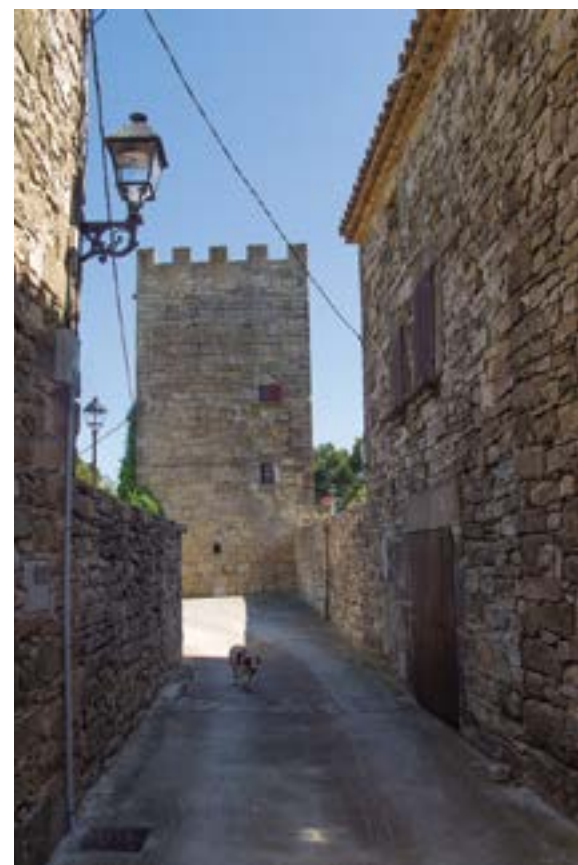
La torre de la Poble de Ferran.