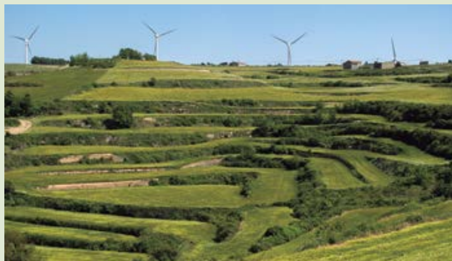
Els Comalats des del fossar de Belltall.

Josep M Sans Travé: Geografia Comarcal de Catalunya