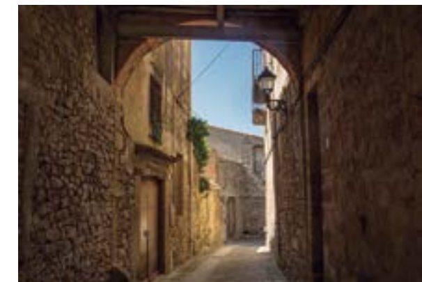
Carrer Major, de Belltall.

Demanu el que sigui, però exigu que estigui cuinat amb els famosos alls de Belltall: val la pena. Aprofiteu per comprar-ne un forc. Un secret: si us poden oferir cuguls, no deixeu passar l'oportunitat de tastar-los. ■