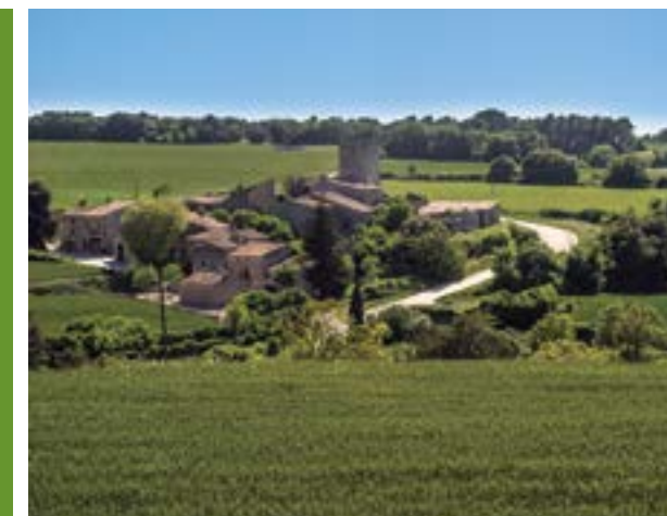
La Sala de Comalats.

http://www.larutadelcister.info/senderisme-btt/ruta-dels-comalats-des-de-belltall