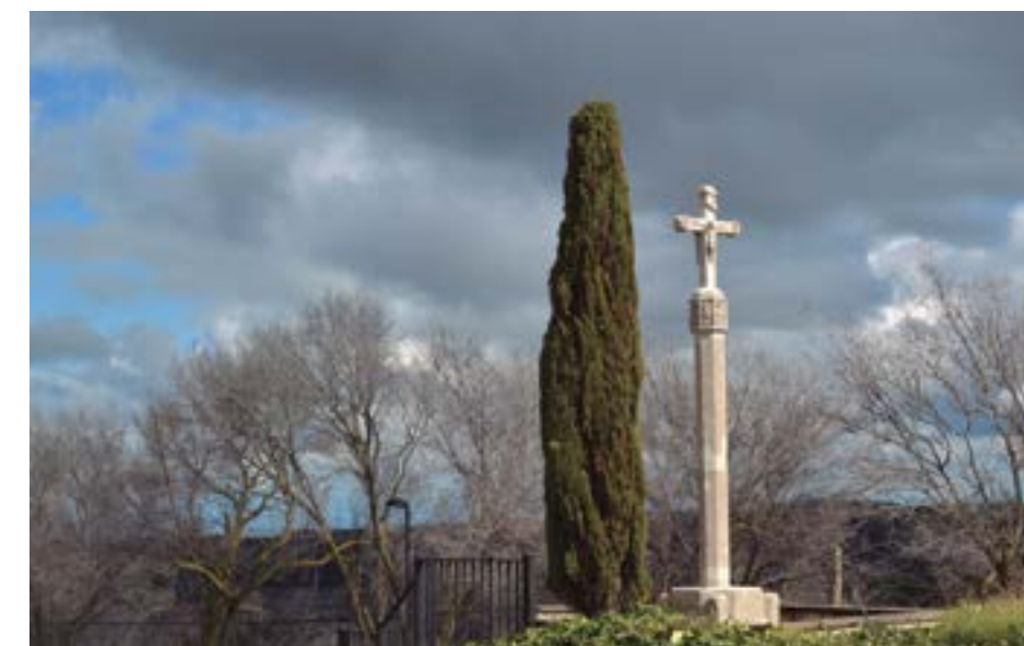
Creu de terme de Belltall (s. XVI), punt de sortida de la nostra ruta.

És un recorregut circular ideal per fer en bicicleta de muntanya. Es pot iniciar des de Belltall o des de Forès i recorre la part dels Comalats, de la Conca de Barberà a tocar de l'Urgell. És una zona amb un paisatge i una climatologia singulars, un territori rural marcat pels cultius de secà, només trencat per unes petites masses boscoses. La ruta transcorre per pobles molt bonics, que conserven alguns dels vestigis històrics que aquesta terra de frontera va tenir al segle X.