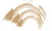
Sala Gòtica Ca Sagarra

L'Espai de la Memòria de Ca Sagarra està pensat com l'entrada a la visita al refugi antiaeri, però també com un centre d'introducció a la història val·lenca i un punt de partida per visitar altres indrets relacionats amb la memòria històrica com són l'hospital de sang, el cementiri o el camp d'aviació, per citar-ne els més rellevants.