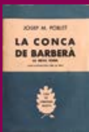
La Conca de Barberà Editorial Selecta, 1961.

En els anys setanta publicà nombrosos llibres sobre la història del catalanisme i el teatre català. Mantingué sempre intacte el seu compromís amb la causa catalanista, que assoliria el seu punt culminant el 10 d'abril de 1980, quan es convertí en el diputat-president de major edat en la sessió constitutiva del Parlament de Catalunya.