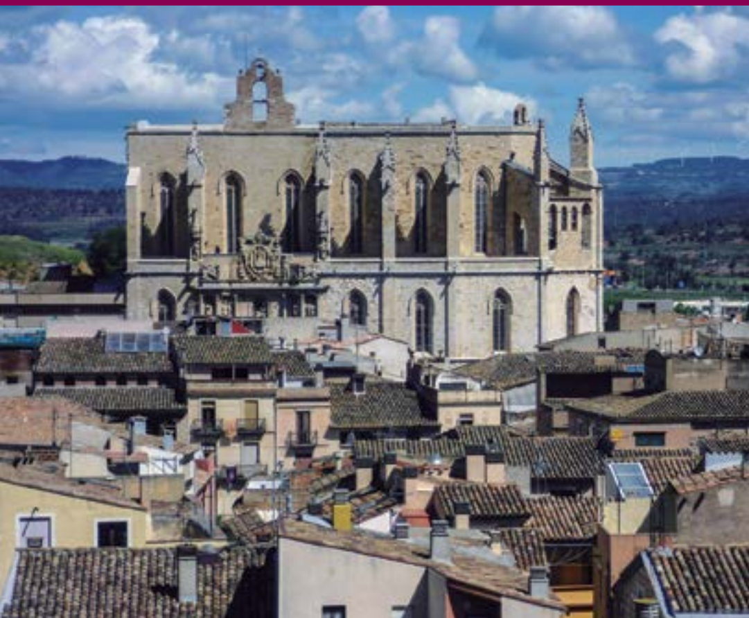
Santa Maria i la Conca al fons des d'una torre de la muralla de Montblanc.