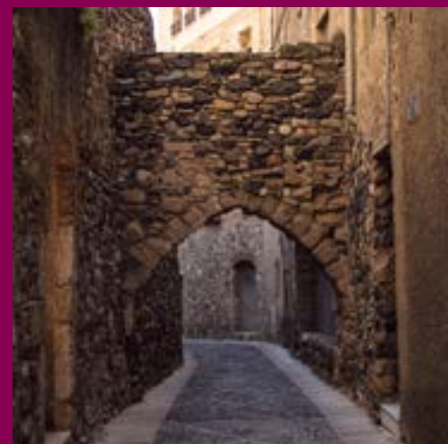
Carrer dels Jueus, de Montblanc.

Blanes, Gaziel a Sant Feliu de Guíxols, Moncada a Mequinensa, Bladé a l'Ebre o Pla a l'Empordà, per citar-ne alguns de molt emblemàtics que han contribuït a dibuixar la nostra geografia literària.