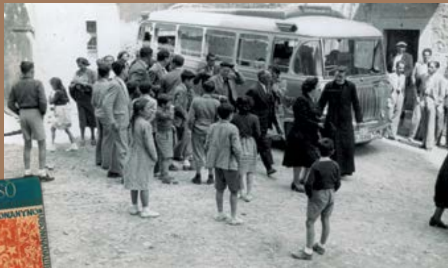
La Selva del Camp, anys 50. Portada del Resso, desembre-gener (1951 - 52)