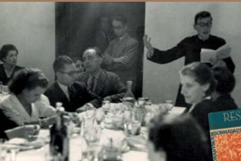
Vallbona de les Monges, anys 40.