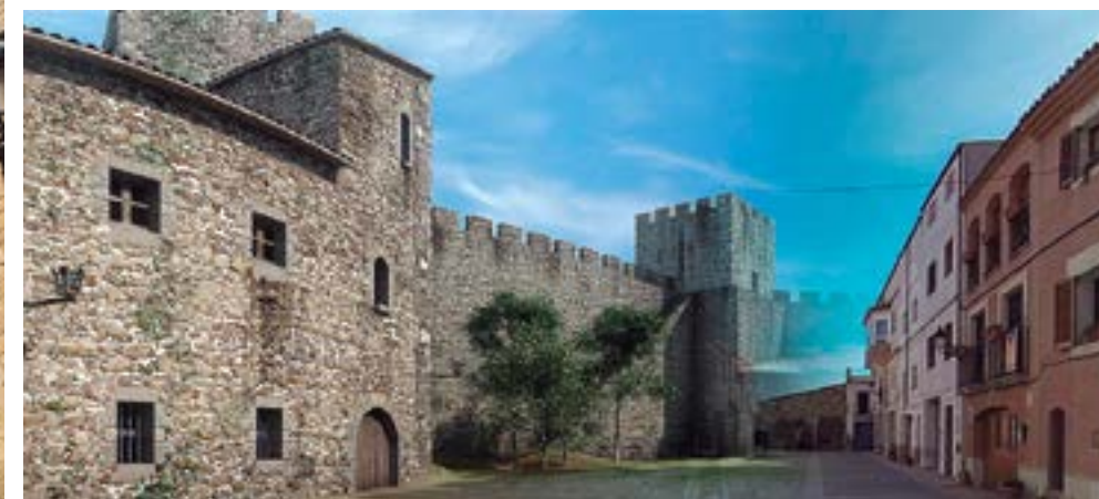
El recorregut continua per la Font Baixa (3) la plaça del castell (5- vista en realitat augmentada) i acaba a la plaça de l'església (10) Informació i ulleres pel mòbil, a l'oficina de turisme.