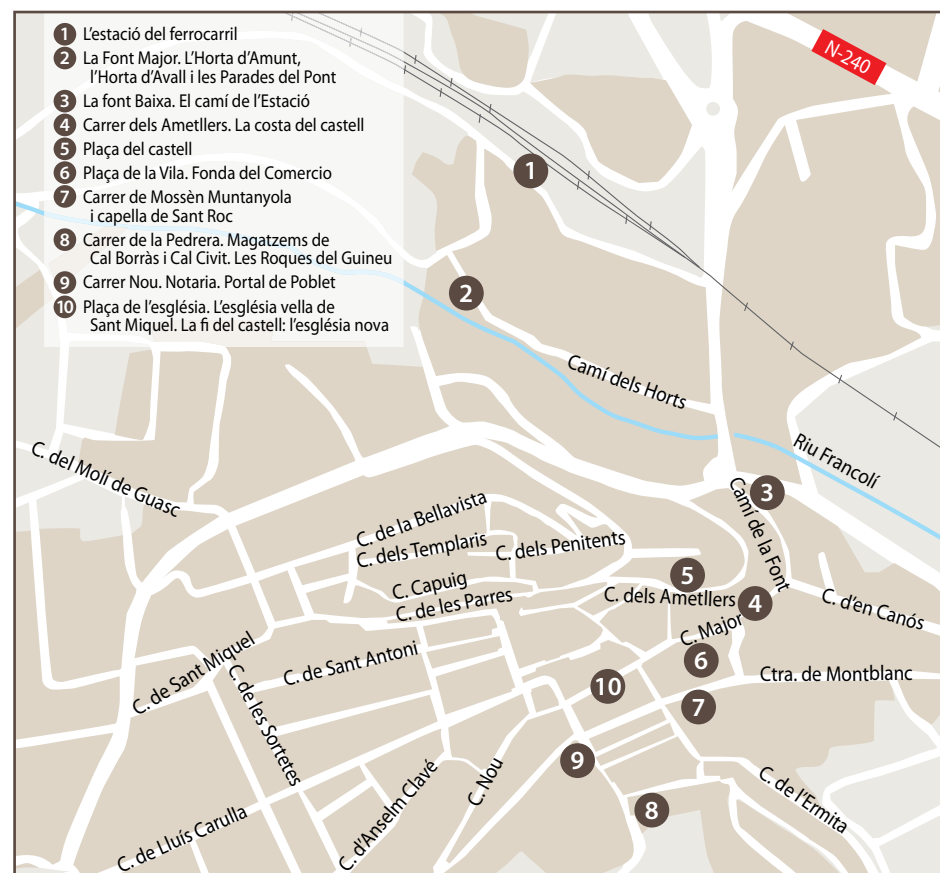
Recorregut urbà amb els escenaris identificats de la novel·la, des de l'estació (1) i el celler cooperatiu (2)