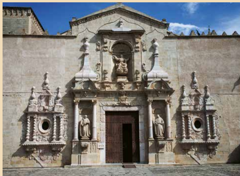
Puerta de entrada a la iglesia

XV, antes de hallarnos ante las impresionantes Torres Reales que constituían la entrada principal al conjunto fortificado que el rey Pedro III construyó en el siglo XIV, que perduran como uno de los mejores ejemplos de arquitectura militar medieval. Al lado y también sobre las murallas, se encuentra la discreta fachada barroca de la iglesia abacial, que data de los siglos XVII-XVIII. En el interior de la fortaleza, podemos encontrar todo un pequeño mundo monástico alrededor de los diversos claustros, patios y espacios abiertos donde durante siglos se ha desarrollado, y perdura hasta la actualidad, la vida de los monjes blancos según la tradición benedictina del Císter. No podemos olvidar la iglesia mayor, que desde el punto de vista espiritual centra la vida del monasterio y también es lugar de reposo de ocho reyes, seis reinas y muchos príncipes y nobles, cuyos nombres son una referencia para nuestra Historia, como Jaime I o Juan I y su hermano Martín I o Pedro el Ceremonioso, y los nombres de María de Luna, María de Navarra, Leonor de Portugal, Juana condesa de Empúries o Carlos Príncipe de Viana, por hacer una breve memoria de tantos otros que unieron para siempre sus nombres al de Poblet. Aún en el presente, la Historia no se detiene, ya que el retorno de los monjes el año 1940 ha permitido continuar su irradiación espiritual y cultural. ■