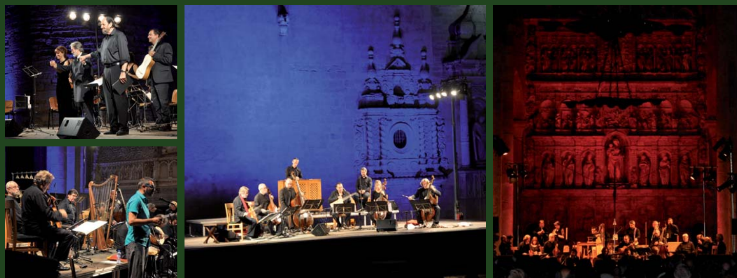
A l'estiu se celebra el Festival de Música Antiga, sota la direcció del prestigiós mestre Jordi Savall.

L'hostatgeria que permet no només gaudir d'una bona restauració, sinó especialment d'un lloc de repòs i pernoctació just dins del recinte monàstic; s'ha adequat l'antic celler com a nou centre d'acollida i recepció dels visitants, i alhora com a botiga de records i punt d'informació i guiatge; s'ha construït una cafeteria nova i s'ha dotat el recinte de nous serveis. A més, s'ha instal·lat la nova senyalització del monestir, s'han renovat els fullets explicatius de la visita i s'han incorporat radioguies per millorar la qualitat de les visites i mantenir el silenci del recinte. Forma part del pla director, la construcció d'un centre d'interpretació que ajudi els visitants a descobrir les claus fonamentals de lectura del complex monàstic, i un jardí bíblic que acabi de completar la visita a Poblet; a part, estableixen noves línies de visita als cellers de Poblet, als arxius o al pou de gel, entre d'altres. D'entre els elements restants que han ajudat a la renovació cultural de Poblet, el nou orgue de tribuna de