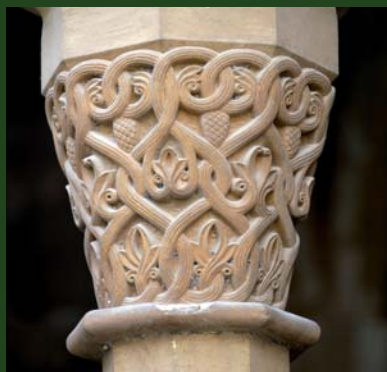
El monestir de Poblet fou fundat el 1150 pel comte Ramon Berenguer IV. La comunitat ha emprès un procés eficaç i sostenible de conversió ecològica.

El monestir de Poblet, declarat Patrimoni de la Humanitat per la UNESCO l'any 1991, és una comunitat viva de monjos cistercencs que, fidels a la seva vocació i a la voluntat fundacional de Ramon Berenguer IV, està duent a terme, conjuntament amb la Fundació Populus alba, un projecte integral de servei al país, a la cultura, a la societat, a l'entorn natural i a l'Església, que ha batejat amb el nom de Programa Cosmos Poblet .