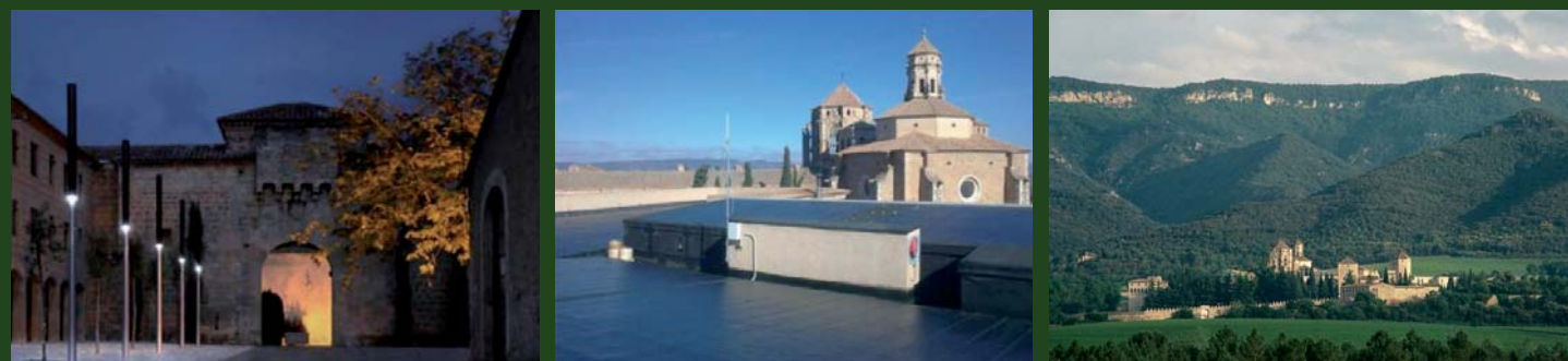
L'hostatgeria de Poblet permet pernoctar dins el recinte monàstic