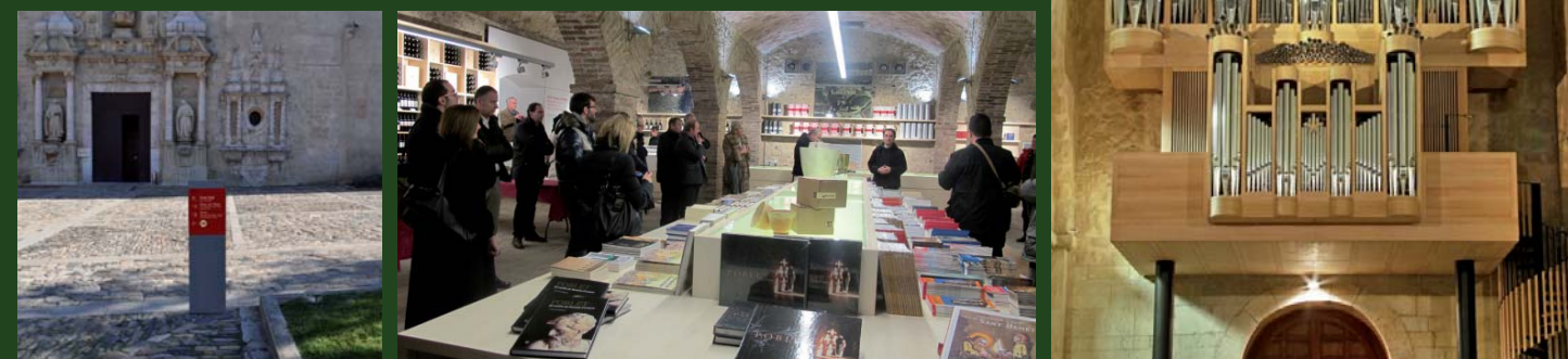
Poblet ha posat en marxa nous equipaments que milloren la recepció i l'acollida dels visitants