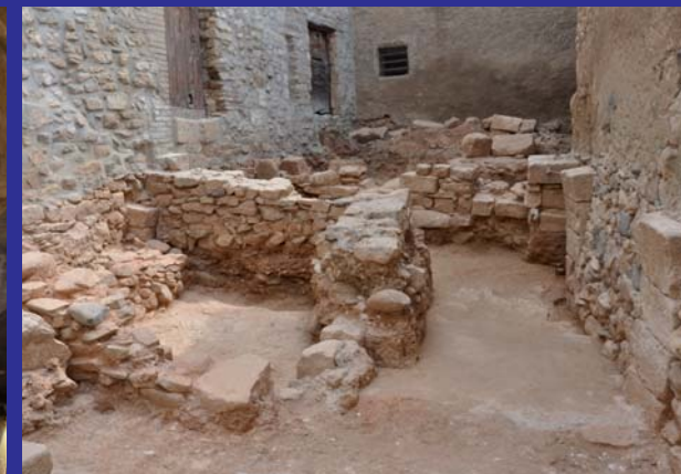
Restes arqueològiques dels segles XIII-XVII trobades al call jueu de l'Espluga Jussana.

La Ruta dels Templers i Hospitalers és una aposta de l'Ajuntament de l'Espluga de Francolí que neix per incrementar la sinergia turística del municipi, emparada per la Llei de barris i el mateix Ajuntament, amb la pretensió de potenciar el nucli antic de la vila (Capuig, Castell, carrers de la Font i Major), i amb l'esperit de ser un estímul per protegir el patrimoni històric medieval que resta a la vila i, a la vegada, impulsar l'economia del centre urbà de l'Espluga.