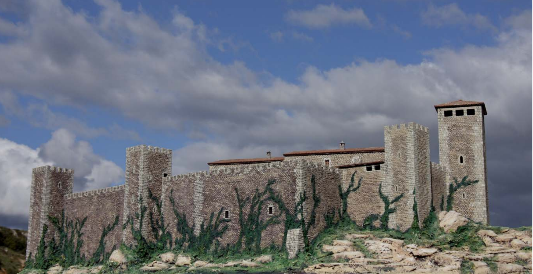
Semblança del castell hospitaler de l'Espluga Jussana durant el segle XIV.

remodelacions d'habitatges del nucli antic, amb sanejaments de façanes i noves edificacions que han preservat els elements patrimonials (arcs, carreus...) i això a la vegada ha permès el total arranjament dels carrers. Quart, revitalitzar econòmicament del centre urbà i nucli antic: a ningú se li escapa que un flux important de visitants, conduït turísticament fins al centre comercial de la vila pot tenir una repercussió