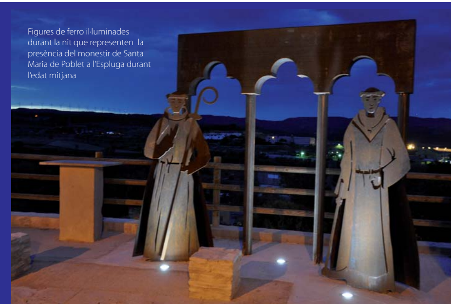
Figures de ferro il·luminades durant la nit que representen la presència del monestir de Santa Maria de Poblet a l'Espluga durant l'edat mitjana