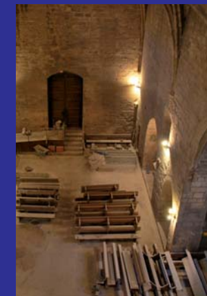
Interior de l'església vella