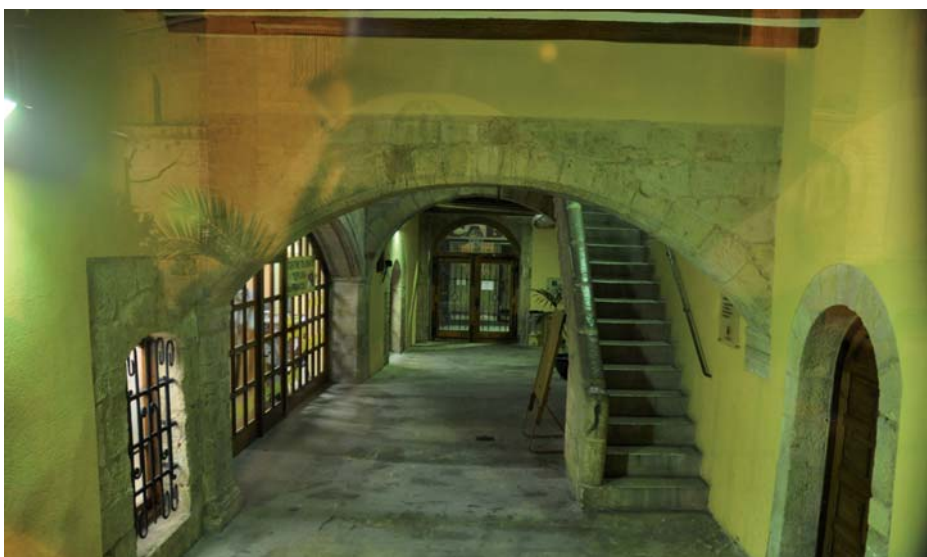
Interior de l'hospital medieval, on es recrearà la quotidianitat d'un hospital de pobres.

Aquest projecte ja és, en part, una realitat, atès que la primera fase està en funcionament des de 2012 (banys jueus – mikvé –, escultures distribuïdes pels carrers que evocuen els estaments socials que hi havia a l'Espluga, plafons expositius en punts adients, il·luminació dels murs del castell...). Properament, es començarà la segona fase, amb l'execució de la quasi totalitat de la ruta, on s'integraran nous punts visitables com la torre del castell hospitaler, un taller virtual d'un vidrier de vitralls que hi havia a l'Espluga en el segle XIV i l'antic hospital de pobres de finals del mateix segle: audiovisuals, ambientacions, recreacions ens transportaran a l'Espluga medieval, on els Hospitalers eren els senyors del lloc i la vida de la població seguia al ritme marcat pel sol, per les seves creences i els seus temors. Aquesta fase s'estima que estarà en funcionament cap a la meitat del proper any. Restarà per concloure la tercera fase dedicada a ressaltar la importància del significat de l'espiritualitat en aquella societat medieval, representada per l'església parroquial de Sant Miquel, edificada a finals del segle XIII, on culminarà la ruta medieval de l'Espluga. ■