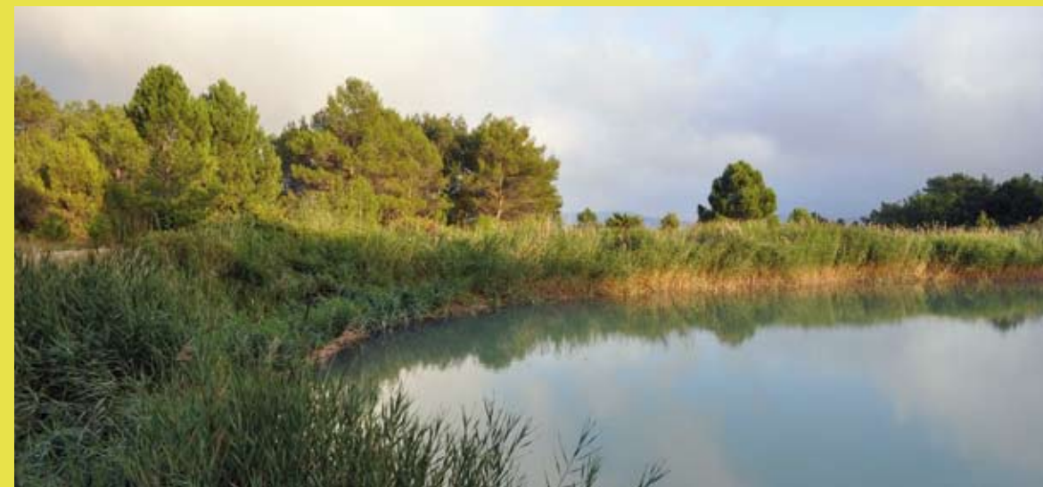
MUNTANYES DE L'ALT GAIÀ