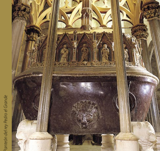
Panteón del rey Pedro el Grande

Y miramos el entorno, fuera de los muros del monasterio. Viñedos ostentosos nos regalan su fruto, árboles y campos cultivados, tierra que produce colores y aromas cambiantes, una tierra tarraconense que acompaña y vigila su monasterio. A lo lejos y desde su