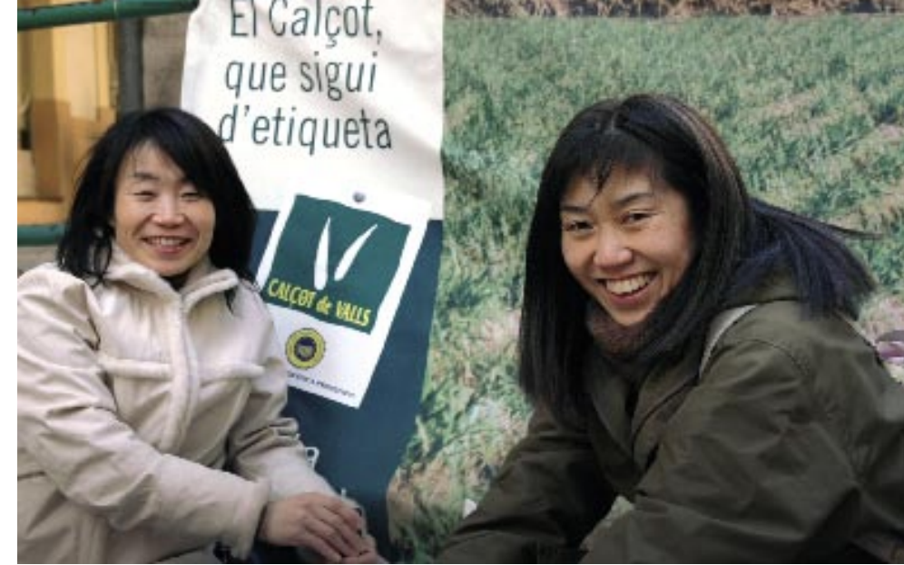
GRAN FESTA DE LA CALÇOTADA DE VALLS

A la pàgina anterior, Calçot de Valls, Indicació Geogràfica Protegida.